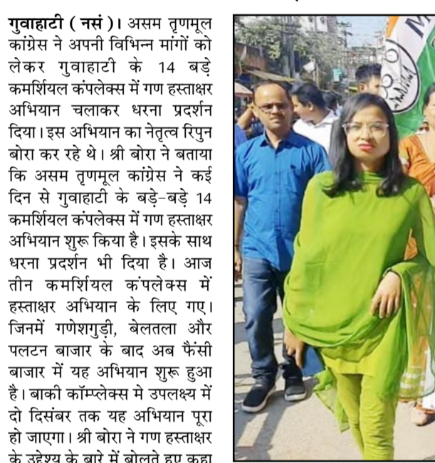
सिटी में संपत्ति कर की वृद्धि, पीने के पानी की कठिनाई भी मूल समस्या के रूप में हमने अपनी मांगों में शामिल कर रखा है। सरकार बार-बार अपने सरकारी वादे के पश्चात भी वादाखिलाफी करती हुई पीने के पानी की कोई इंतजाम नहीं कर पाई है। यह सारी समस्याओं को लेकर यह प्रतिवाद धरना चल रहा है।