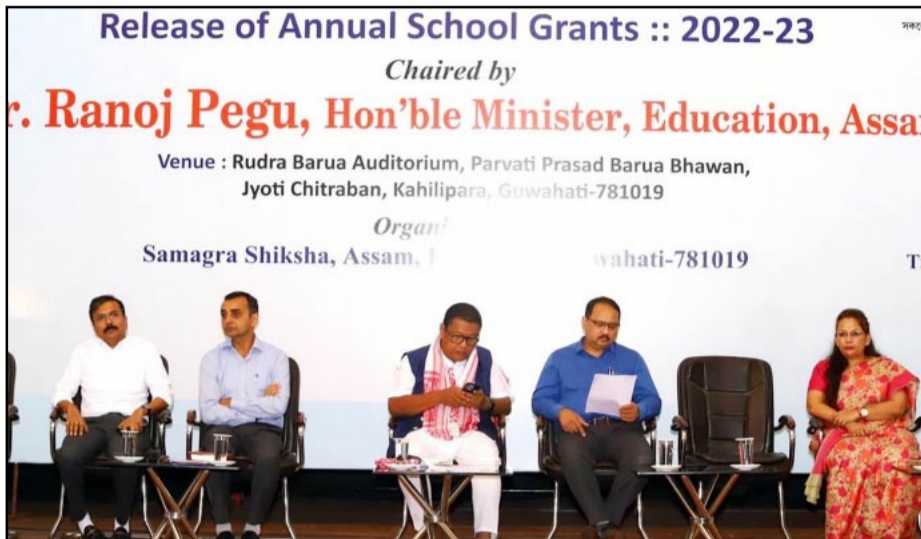
कि बिना कटोर हुए आप अच्छा काम नहीं कर पाएंगे। उन्होंने कहा कि असम आंदोलनों की भूमि है। बच्चा रोने पर ही मां दूध पिलाती है।