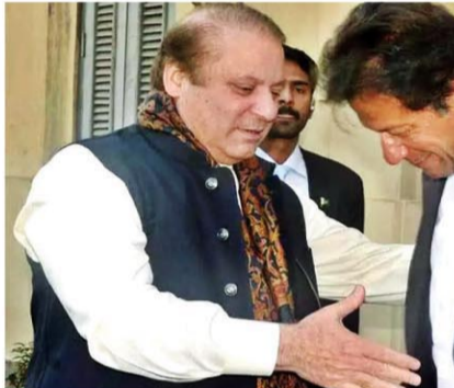
एक दिन, यह सब जनता के सामने स्पष्ट हो जाएगा। नवाज शरीफ ने कहा, सर से पांव तक भ्रष्टाचार में फंसे इमरान दूसरे पर

लंदन। पाकिस्तान के पूर्व प्रधानमंत्री नवाज शरीफ ने कहा है कि इमरान खान और उनके करीबी 50 अरब रुपये के भ्रष्टाचार में शामिल हैं और अब तक जो कुछ सामने आया है, वह उनके भ्रष्टाचार की वास्तविक सीमा का एक अंश मात्र है। सूत्रों के मुताबिक, तीन बार के प्रधानमंत्री नवाज शरीफ ने इमरान खान पर पाकिस्तान और पाकिस्तान के राजनीतिक नेतृत्व को बदनाम करने की साजिश का हिस्सा होने का आरोप लगाया। तोशाखाना रेफरेंस में सामने आए हालिया ऑडियो और अन्य सबूतों की ओर इशारा करते हुए नवाज शरीफ ने कहा, इमरान खान को विचार करने की जरूरत है, उनके खिलाफ कई आरोप हैं, उनके कथित भ्रष्टाचार के सबूत बढ़ रहे हैं।