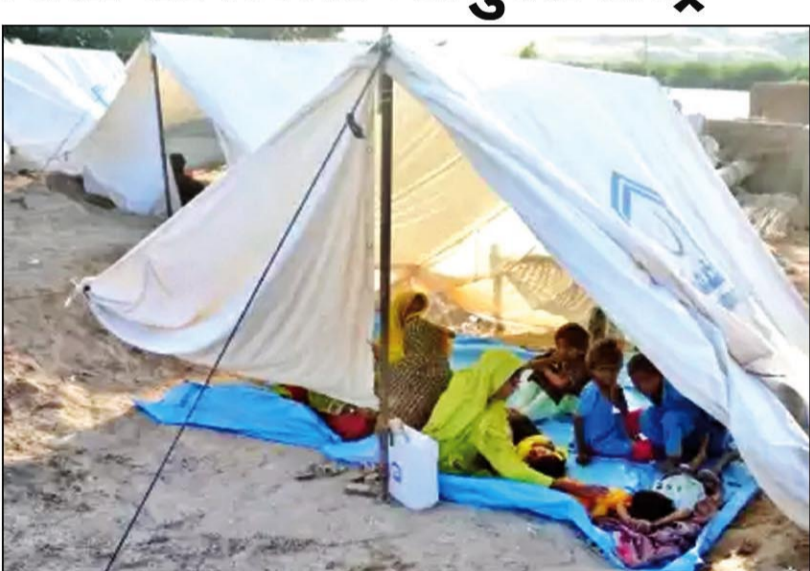
लेकिन ओसीएचए ने कहा कि जैसे ही सर्दी आती है, अधिक संसाधनों की तत्काल आवश्यकता बढ़ जाती है। कार्यालय ने बताया कि अभी तक 816 मिलियन डॉलर की बाढ़ प्रतिक्रिया योजना के तहत लोगों को सिर्फ 23 प्रतिशत ही प्राप्त हुआ है।

संयुक्त राष्ट्र। संयुक्त राष्ट्र के मानवावादाियों ने बताया कि पाकिस्तान में 2 करोड़ से अधिक लोग मानवीय सहायता पर निर्भर हैं और जैसे-जैसे सर्दी बढ़ेगी, वैसे ही लोगों की जरूरतें भी बढ़ती जाएंगी। संयुक्त राष्ट्र के मानवीय मामलों के समन्वय कार्यालय (ओसीएचए) ने शुक्रवार को कहा कि पाकिस्तान में 20 मिलियन से अधिक लोग मानवीय सहायता पर निर्भर हैं, जिसके कारण महत्वपूर्ण मानवीय जरूरतें बनी हुई हैं, हालांकि कुछ क्षेत्रों में पुनर्निर्माण के प्रयास शुरू हो गए हैं। कार्यालय ने कहा, सरकार की प्रतिक्रिया के समर्थन में, हमारे मानवीय सहयोगी बाढ़ के बाद से 4.7 मिलियन से अधिक लोगों तक सहायता पहुंचा चुके हैं। उन्होंने कहा, हमारे सहयोगियों ने 125,000 बच्चों को उनकी शिक्षा फिर से शुरू करने में मदद की है, जिसमें 500 से अधिक अस्थायी शिक्षण केंद्र शामिल हैं। हालांकि, 20 लाख से अधिक बच्चों के लिए फिलहाल स्कूल पहुंच से बाहर हैं। सूत्रों के अनुसार, भले ही लगभग 2.6 मिलियन लोगों को संयुक्त राष्ट्र और उसके सहयोगियों के माध्यम से खाद्य सहायता प्राप्त हुई,