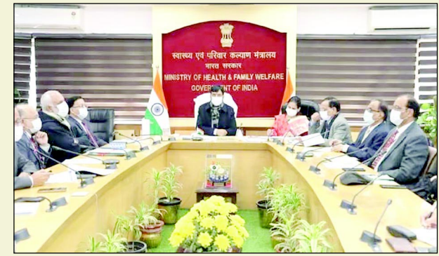
मंडाविया ने उच्च स्तरीय बैठक की। इसमें चीन व अन्य देशों में कोरोना की स्थिति को देखते हुए एहतियाती उपायों पर मंथन किया गया। केंद्रीय

नई दिल्ली। दुनिया के कई देशों में कोरोना वायरस एक बार फिर कहर बरपा रहा है। खासकर चीन में यह अपना रौद्र रूप धारण कर चुका है। कोरोना की चपेट में आने वाले मरीजों की बढ़ती संख्या में मौतें हो रही हैं। लगातार बढ़ते संक्रमण के बीच भारत में भी कोरोना वायरस से निपटने के लिए अभी से पूरी सख्ती बरतने और सभी कोविड नियमों का पालन कराने के लिए रणनीति बनाना शुरू कर दी है। कोरोना महामारी को लेकर बुधवार को केंद्रीय स्वास्थ्य मंत्री मनसुख