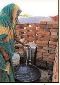
हर घर जल अभियान की इसमें बड़ी भूमिका रही है। इससे पहले एक वित्तीय वर्ष में सबसे ज्यादा फंक्शनल हाउस होल्ड टैप कनेक्शन (एफएफटीसी) देने वाले राज्यों की श्रेणी में भी उत्तर प्रदेश शामिल हो चुका है। उत्तर प्रदेश एक दिन में सर्वाधिक नल कनेक्शन देने का रिकार्ड भी अपने नाम कर चुका है।

लखनऊ, (हि.स.)। उत्तर प्रदेश में 25 फीसदी ग्रामीण परिवारों तक नल से जल की आपूर्ति शुरू हो गई है। राज्य सरकार ने शनिवार को हर घर नल योजना का 25 प्रतिशत का आंकड़ा पार कर लिया है। भारत सरकार ने इस उपलब्धि पर योगी सरकार और उनकी पूरी टीम को बधाई दी है। नए साल में प्रवेश करने के साथ ही योगी सरकार ने हर घर जल योजना से 25 प्रतिशत परिवारों तक नल से जल पहुंचाने का बड़ा लक्ष्य हासिल कर लिया है। खासतौर से तब जबकि छह महीने पहले हर घर जल योजना की प्रगति का आंकड़ा 12 फीसदी था। नमामि गंगे एवं ग्रामीण जलापूर्ति विभाग ने केवल छह महीने में 13 फीसदी प्रगति का रिकार्ड हासिल करते हुए 25 फीसदी परिवारों तक नल कनेक्शन पहुंचाने का लक्ष्य हासिल किया। इस योजना से सरकार ने 66,29,491 परिवारों तक शुद्ध पेयजल पहुंचा दिया है। 3,97,76,946 से ज्यादा ग्रामीण जनता लाभान्वित होगी। नमामि गंगे एवं ग्रामीण जलापूर्ति विभाग के एक प्रवक्ता ने बताया कि पिछले एक सप्ताह में योजना ने एक फीसदी से अधिक परिवारों तक हर घर जल पहुंचाने का लक्ष्य पूरा किया है। 25 दिसंबर से शुरू हुए संकल्प अटल