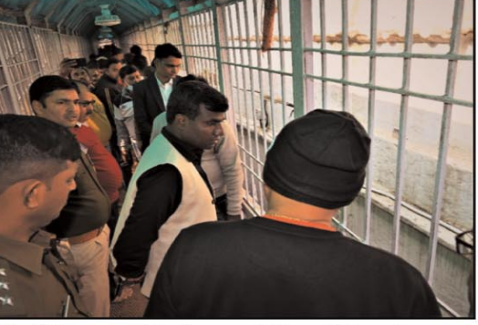
अधिकारियों को दिया। बाबा मंदिर में जलापूर्णा करने आए श्रद्धालुओं की सुविधा हेतु क्यू कॉम्प्लेक्स में स्टाइलिंग, शुद्ध पेयजल एवं स्वच्छ शौचालय व साफ-सफाई व्यवस्था का निरीक्षण करते हुए उपायुक्त ने प्रतिनियुक्त सुरक्षाकर्मियों को श्रद्धालुओं की सहायता व व्यवहार को शांलीन बनाए रखने की बात कही तथा फुट ओवर ब्रिज के समीप विजली की तारों को व्यवस्थित करने

देवघर, (हि. स.)। उपायुक्त मंजूनाथ भर्जंत्री ने नववर्ष के अवसर पर बाबा मंदिर आने वाले श्रद्धालुओं की सुविधा, सुरक्षा व सुलभ जलापूर्णा के लिए बनाए गए सम्पूर्ण रूट लाइन का निरीक्षण किया। इस दौरान वे पैदल भ्रमण कर श्रद्धालुओं की सुविधा, स्वास्थ्य एवं सुरक्षा व्यवस्था को लेकर सरकार भवन मोड, बीएड कॉलेज, तिवारी चौक, चिल्ड्रेन पार्क, क्यू कॉम्प्लेक्स, फुट ओवरब्रिज व बाबा मंदिर प्रांगण का निरीक्षण कर संबंधित विभाग के अधिकारियों को निर्देश भी दिया। डीसी ने श्रद्धालुओं की सुविधा व सुरक्षा को लेकर बीएड कॉलेज के समीप अतिक्रमण, आरके मिशन के समीप मेधा डेअरी प्लाईट को हटाने का निर्देश संबंधित विभाग के कार्यालयक अभियंता को दिया। उन्होंने आसपास के इलाकों में अतिक्रमण, नालों और सड़को की साफ सफाई को दुरुस्त रखने का निर्देश नगर निगम के वरीय