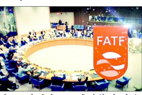
काफी प्रगति की। साल 2008 में उसने एंटी-मनी लॉन्ड्रिंग एक्ट में संशोधन किया था। इसके बाद नेपाल साल 2014 में इस लिस्ट से बाहर आ गया

काठमांडू। पाकिस्तान की तरह नेपाल पर भी अब फाइनेंशियल एक्शन टास्क फोर्स (एफएटीएफ) की ग्रे लिस्ट में आने का खतरा बढ़ गया है। नेपाली मीडिया के अनुसार पिछले दिनों एफएटीएफ की एशिया-प्रशांत क्षेत्र ने देश का दौरा किया है। एफएटीएफ अंतर्राष्ट्रीय स्तर पर मनी-लॉन्ड्रिंग और टैरर फाइनेंसिंग पर नजर रखती है। इस टीम के दौरे के बाद लोगों चिंता है कि अगर नेपाल ग्रे लिस्ट में आ गया तो कितनी बड़ी मुसीबत पैदा हो सकती है। बता दें कि नेपाल साल 2008 से 2014 तक एफएटीएफ की ग्रे लिस्ट में था। उसके बाद उसने इस दिशा में