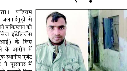
पृष्ठताड़ के दौरान किया। इतना ही नहीं उसने स्वीकार किया है कि वह इसकी तैयारी कर रहा था, लेकिन काम को अंजाम देने से पहले ही वह गिरफ्तार हो गया। पुलिस के सूत्रों के अनुसार, जब उसे गिरफ्तार किया गया, तब वह क्षेत्र में भारतीय सेना और वायुसेना के ठिकानों पर तैनात अधिकारियों के मोबाइल नंबर और तस्वीरें जुटा रहा था। पृष्ठताड़ में उसने बताया कि उस