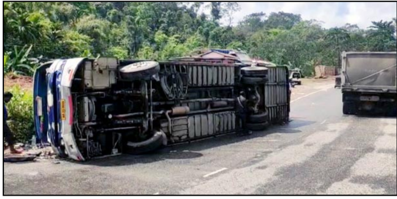
रि-भोई (हि.स.)। मेघालय के रि-भोई जिलांतगत सुपर बस दुर्घटनाग्रस्त हो गई, जिसके चलते बस नोंगपोह थाना क्षेत्र के शांगबंगला इलाके में नाइट में सवार लगभग सभी लोग घायल हो गए। पुलिस

ने मंगलवार को बताया कि बीती रात शांगबंगला डाउन इलाके में राष्ट्रीय राजमार्ग-6 पर लगभग 11.30 बजे एक नाइट सुपर टूरिस्ट बस (एआर-20-9099) दुर्घटनाग्रस्त हो गई। जिसके चलते बस में सवार 37 यात्री घायल हो गए। बस यात्रियों को लेकर सिलचर जा रही थी। बस में भारी मात्रा में अवैध तरीके से सज्जी लदा हुआ था। घटना की खबर मिलते ही मौके पर पहुंची पुलिस को टीम ने 108 एंबुलेंस के जरिए घायल यात्रियों को सिविल अस्पताल नोंगपोह में पहुंचाया गया। कुछ घायल व्यक्तियों को प्राथमिक उपचार के बाद गुवाहाटी रेफर कर दिया गया। पृष्ठताछ के दौरान पता चला कि वास्तविक कारण हादसा ब्रेक फेल होने के कारण हुआ है। सभी कानूनी औपचारिकताओं को पूरा कर लिया गया है। पुलिस इस संबंध में एक प्राथमिकी दर्ज कर मामले की जांच कर रही है।