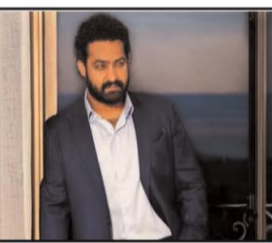
है कि वॉर 2 प्लॉट के साथ-साथ स्केल के मामले में भी पहली फिल्म को पीछे छोड़ रही है। त्रिक रेशन बनाम जूनियर एनटीआर का यद रखने वाला एक्शन सीन होगा। जूनियर एनटीआर के शामिल होने से फैंस के बीच फिल्म को लेकर उत्साह बढ़ गया है। एक सूत्र ने पुष्टि की, कि जूनियर एनटीआर त्रिक रेशन के साथ वॉर 2 में भिड़ेंगे। उन्होंने कहा, उनका एक्शन और उनका परफॉर्मेंस निश्चित रूप से बड़े पर्दे पर यद रखने वाला होगा। वॉर पूरी तरह से भारतीय फिल्म है।

साउथ के सुपर स्टार जूनियर एनटीआर को स्पॉट एक्शन-थ्रिलर, वॉर 2 के लिए साइन किया गया है। यह फिल्म 2019 की ब्लॉकबस्टर का अगला सीक्वल है। इस फिल्म का निर्देशन अयान मुखर्जी करेंगे। अयान मुखर्जी ने बॉलीवुड में कई ब्लॉकबस्टर फिल्में दी हैं, जिसमें उनकी आखिरी रिलीज ब्रह्मास्त्र भी शामिल है। आदित्य चोपड़ा का यह कदम वॉर 2 को एक हिंदी फिल्म के लिए सबसे व्यापक दर्शकों की अपील करने में सक्षम बनाता है और यह फिल्म की बॉक्स ऑफिस क्षमता को भी बढ़ाता है। सूत्र ने आगे बताया कि जूनियर एनटीआर साउथ इंडस्ट्री के सबसे सम्मानित और फॉलो किए जाने वाले आइकन में से एक हैं। कहा जाता है कि वह अपनी फिल्मों को काफी सोच-विचार के बाद चुनते हैं। उन्होंने कहा, अगर उन्होंने फिल्म को हामी भर दी है, तो इसका मतलब है कि वह अपनी फिल्मों को काफी सोच-विचार के बाद चुनते हैं। उन्होंने कहा, अगर उन्होंने फिल्म को हामी भर दी है, तो इसका मतलब है कि वह अपनी फिल्मों को काफी सोच-विचार के बाद चुनते हैं।