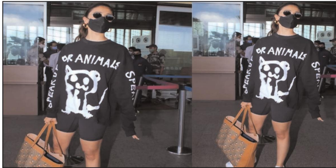
वह अपने बालों को लो पोनीटेल में बांधती नजर आ रही थीं। हालांकि, आलिया ने एक लोअर बैग भी कैरी किया हुआ था, जिसने तुरंत ही रेडिटर्स का ध्यान अपनी ओर खींच लिया।

बॉलीवुड की सबसे सफल अभिनेत्रियों में से एक आलिया भट्ट ने अपने अभिनय कौशल और शालीनता से सभी को मंत्रमुग्ध कर दिया है। अभिनेत्री अपने व्यक्तिगत और पेशेवर दोनों मोर्चे से सुखियों में आने से कभी नहीं चूकतीं। उन्होंने अपने करियर की शुरुआत फिल्म स्टूडेंट ऑफ द ईयर से की थी और तब से उन्होंने कभी पीछे मुड़कर नहीं देखा। उनकी सबसे सफल फिल्मों में से एक गंगुबाई काठियावाड़ी है, जिसके लिए उनकी काफी प्रशंसा की गई थी। हालांकि, अभिनेत्री को अक्सर उनके प्रशंसकों द्वारा ट्रोल किया जाता है, चाहे वह उनके फैशन का मामला हो, व्यक्तिगत जीवन या आईक्यू स्तर का मामला हो। आलिया भट्ट वर्तमान में रेडिट पर अपनी एक पुरानी तस्वीर के कारण ट्रोलिंग के निशाने पर हैं। 2021 में ली गई आलिया भट्ट की एक पुरानी तस्वीर में उन्हें एक टी-शर्ट पहने हुए दिखाया गया है, जिस पर लिखा है, "आनवरों के लिए बोलो"। हम एक्ट्रेस को इस ओवरसाइज़्ड टी-शर्ट को ब्लैक शॉर्ट्स के साथ पेश कर रहे हुए देख सकते हैं। अभिनेत्री ने काला धूप का चश्मा और सफेद स्नीकर्स की एक जोड़ी पहनी है।