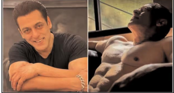
हैं, जिन्हें हम बहन बनाना चाहते हैं। सलमान खान का ये वीडियो सोशल मीडिया यूजर्स को खूब पसंद आ रहे हैं, जिस अंदाज में सलमान अपनी बात कह रहे हैं, उस स्टाइल की सभी तारीफ कर रहे हैं। हालांकि, कुछ कमेंटर्स सलमान के रिलेशनशिप पर भी हैं, ऐसे ही एक ने कमेंट किया

मुंबई (ईएमएस)। बॉलीवुड अभिनेता सलमान खान इन दिनों अपनी अपकमिंग फिल्म को लेकर चर्चा में हैं, जिसका नाम किसी का भाई किसी की जान है। ऐसे में हाल ही में सलमान खान ने एक सवाल पर मजेदार अंदाज में कहा कि वो पूरे इंडिया के भाईजान नहीं हैं, कुछ के सिर्फ जान भी हैं। वीडियो में दिखा रहा है कि सलमान खान से रिपोर्टर पूछती हैं, सलमान, आप पूरे इंडिया के भाई जान हैं, ऐसे में जो धमकियाँ मिलती हैं उसे कैसे देखते हैं आप? रिपोर्टर का आधा सवाल सुनकर ही सलमान कहना शुरू कर देते हैं कि पूरे इंडिया के भाईजान नहीं हैं, किसी की जान भी हैं। बहुत सारों की जान भी हैं हम, अरे... भाईजान उनके लिए हैं, जो कि भाई हैं और उनके लिए