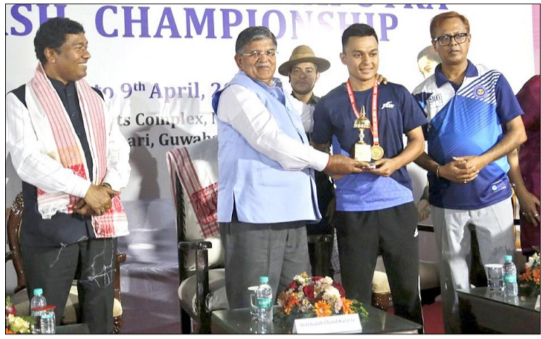
आयोजित कर रहा है। राज्यपाल ने स्ववैश दीपिका पल्लीकल कार्तिक, जोशाना चिनप्पा, के क्षेत्र में देश का नाम रोशन करने वाली सौरभ घोषाल जैसे खिलाड़ियों की भी

गुवाहाटी (हिंस)। असम के राज्यपाल गुलाब चंद कटारिया ने आज यहां शहर के आरजी बरुवा स्पोर्ट्स कॉम्प्लेक्स, उलुबारी में तीसरी अखिल भारतीय ब्रह्मपुत्र स्ववैश चैंपियनशिप, 2023 के समापन समारोह में भाग लिया। इस अवसर पर राज्यपाल ने कहा कि खेल व्यक्ति के व्यक्तित्व को आकार देते हैं। यह व्यक्ति को अनुशासित भी बनाता है, जातियों के भेद को मिटाता है, टीम भावना का निर्माण करता है और व्यक्तियों में एकता की भावना को बढ़ाता है। कटारिया ने कहा कि स्ववैश असम में लोकप्रिय हो गया, क्योंकि 2016 में गुवाहाटी में 12वें दक्षिण एशियाई खेलों का आयोजन किया गया था। खेलों को फैलाने के लिए राज्य सरकार द्वारा चार अत्याधुनिक विश्व स्तरीय स्ववैश कोर्ट बनाए गए हैं। तब से एसोसिएशन कोर्टों और खिलाड़ियों के लिए नियमित प्रशिक्षण