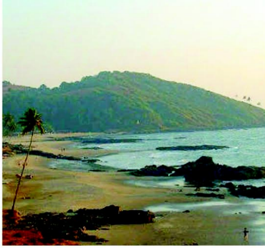
अन्य ग्रंथों के अलावा हरिवंशम और स्कंद पुराण में मिलता है।

महाभारत में गोवा का उल्लेख गोपराष्ट्र यानि गाय चरानेवालों के देश के रूप में मिलता है। दक्षिण कोंकण क्षेत्र का उल्लेख गोवा राष्ट्र के रूप में पाया जाता है। संस्कृत के कुछ अन्य पुराने स्त्रोतों में गोवा को गोपकपुरी और गोपकपट्टन कहा गया है जिनका उल्लेख