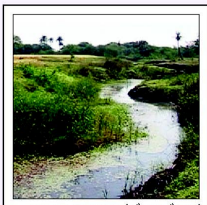
टाइफाइड अकसर वहाँ फैलता है जहाँ साफ-सफाई का ख्याल नहीं रखा जाता। उचित जल आपूर्ति और अपशिष्ट निपटान प्रणाली इस रोग की रोकथाम के लिए बेहद आवश्यक है।