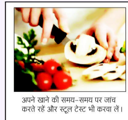
अपने खाने की समय-समय पर जांच करते रहें और स्टूल टेस्ट भी करवा लें।