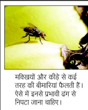
मक्खियों और कीड़े से कई तरह की बीमारियां फैलती हैं। ऐसे में इनसे प्रभावी ढंग से निपटा जाना चाहिए।