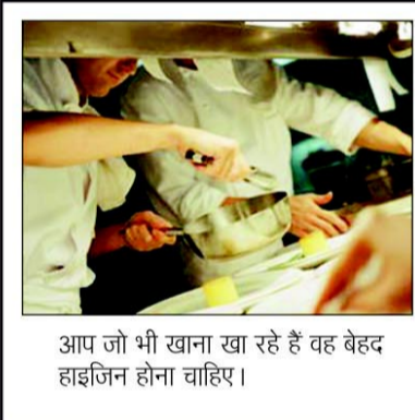
आप जो भी खाना खा रहे हैं वह बेहद हाइजिन होना चाहिए।

टाइफाइड बेहद खतरनाक बुखार है। यह साल्मोनेला टाइफी नामक बैक्टीरिया का संक्रमण होता है। इस बीमारी में काफी तेज बुखार आता है, जो कई दिनों तक रहता है। यह बुखार कम-ज्यादा होता रहता है, लेकिन कभी सामान्य नहीं होता। ऐसे में टाइफाइड होने पर किन बातों का ध्यान रखा जाए, आइए जानते हैं-