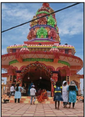
साथ शुरू हुआ था, जिसका समापन

खूंटी, (हि.स.)। उग्रवाद प्रभावित रनिया थाना क्षेत्र का कोटगिर गांव, जहां पांच-सात वर्ष पहले तक नक्सलियों की गोली की तड़तड़ाहट से पूरा इलाका दहलता था। पहाड़ों और हरे भरे जंगलों के बीच इसी कोटगिर गांव में आज वेद मंत्रोच्चारण और घंट-शंख की ध्वनि और अखंड हरिकीर्तन की गूंज सुनकर एक सुखद अनुभूति होती है। इसी गांव में स्थित चंद्रमुखी हनुमान मंदिर का प्रथम स्थापना दिवस मनाया गया है। स्थापना दिवस कार्यक्रम शुक्रवार को कलश यात्रा और कई धार्मिक अनुष्ठान के