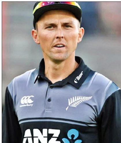
गेंदबाज के अनुसार उनकी टीम भारत में अक्टूबर-नवंबर में विजेता बन सकती है

बोल्ट गत वर्ष हुए टी20 विश्व कप के बाद से ही टीम से बाहर हैं क्योंकि चयनकर्ताओं ने अनुबंधित खिलाड़ियों को ही टीम में जगह दी है। वहीं अब बोल्ट ने कहा, "मेरी अब भी पूरी इच्छा है कि मैं न्यूजीलैंड की तरफ से इस आईसीसी टूर्नामेंट में खेलूं। मैं भाग्यशाली रहा कि मुझे न्यूजीलैंड की तरफ से 13 साल तक खेलने का मौका मिला। न्यूजीलैंड की टीम साल 2019 में विश्व कप फाइनल में पहुंचकर हार गयी थी पर इस तेज