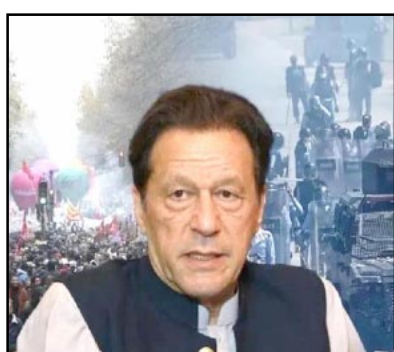
बड़ी और एकमात्र संघीय पार्टी बिना किसी जवाबदेही के राज्य सत्ता के पूर्ण रोष का सामना

इस्लामाबाद। पाकिस्तान के पूर्व मुख्यमंत्री इमरान खान, उनकी पत्नी बुशरा बीबी और उनकी पार्टी पाकिस्तान तहरीक-ए-इंसाफ (पीटीआई) के 80 अन्य सदस्यों को नो फ्लाई लिस्ट में डाल दिया गया है। सूत्रों ने गुरुवार को यह जानकारी दी। सैन्य प्रतिष्ठानों पर उनके समर्थकों द्वारा किए गए हमलों के बाद विकास उनके राजनीतिक दल पर संभावित प्रतिबंध की अटकलों के बीच आया है। बुधवार को इमरान खान ने पाकिस्तान के लोगों को संबोधित करते हुए कहा था कि उनकी पार्टी पर बड़े पैमाने पर कार्रवाई की जा रही है। 25 मई को इमरान खान ने ट्विटर पर आरोप लगाया कि पाकिस्तान सरकार पार्टी को खत्म करने की कोशिश कर रही है। उन्होंने ट्वीट करते हुए कहा कि आज सबसे