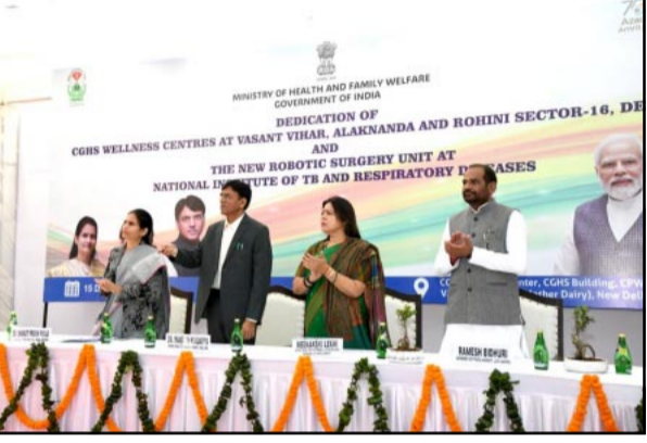
सर्जरी उन्हें सही देखभाल प्रदान करने में सहायक होगी। देश के अंतिम छोर तक सुलभ और किफायती स्वास्थ्य सेवा प्रदान करना हमारा लक्ष्य है और एक स्वस्थ राष्ट्र की नींव है। उन्होंने कहा कि दुनिया में निर्धारित 10 में से 4 दवाएं भारत में बनी जेनेरिक दवाएं हैं। जन औषधि दवाएं सीजीएचएस कल्याण केंद्रों में भी प्रदान की जाती हैं। भारत में 1.6 लाख से अधिक आयुष्मान आरोग्य मंदिर स्थापित हैं, प्रत्येक 10,000 लोगों पर 1 आरोग्य मंदिर जनता को समग्र उपचार प्रदान करता है।

नई दिल्ली ( हि.स. ) । केंद्रीय स्वास्थ्य मंत्री डॉ. मनसुख मांडविया ने कहा कि सीजीएचएस के तहत बनकर किए गए शहरों की संख्या साल 2014 में 25 थी, जो बढ़कर 2023 में 80 हो गई। पिछले नौ सालों में सीजीएचएस शहरों की संख्या तीन गुना से अधिक हो गई है। आने वाले दिनों में इस सुविधा का 100 शहरों तक विस्तार किया जाएगा। डॉ. मांडविया शुक्रवार को अलकनंदा, रोहिणी सेक्टर-16, वसंत विहार में तीन सीजीएचएस वेलनेस सेंटर के साथ-साथ एनआईटी और आरडी में एक रोबोटिक यूनिट के उद्घाटन समारोह को संबोधित कर रहे थे। इस मौके पर उन्होंने कहा कि देश में 341 सीजीएचएस वेलनेस सेंटर 44 लाख लाभार्थियों को सेवा दे रहे हैं और नेशनल इंस्टीट्यूट ऑफ टीबी एंड रीस्पैटरी डिजीज (एनआईटी एंड आरडी) में तीन सीजीएचएस वेलनेस सेंटर और रोबोटिक यूनिट को स्थापना से उनकी स्वास्थ्य देखभाल सुविधाओं में उल्लेखनीय वृद्धि होगी। केंद्रीय स्वास्थ्य मंत्री ने कहा कि सर्जरी की आवश्यकता वाले तपेदिक से पीड़ित रोगियों के लिए स्वास्थ्य सुविधाएं सुनिश्चित करने के लिए रोबोटिक