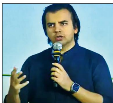
भाविश ने अप्रैल में बनाई थी एआई कंपनी

नया टूल भारत का पहला फुल-स्टैक एआई के रूप में कैटगोराइज किया गया है। कंपनी का दावा है कि कृत्रिम स्थानीय भारतीय ज्ञान, भाषाओं और डेटा पर बनाया गया है। अग्रवाल ने इस टूल को सभी के लिए फायदेमंद बताया है। हालांकि अभी ये क्लियर नहीं है कि किस तरह ये टूल काम करेगा और क्या-क्या सुविधाएं आम लोगों को देगा।