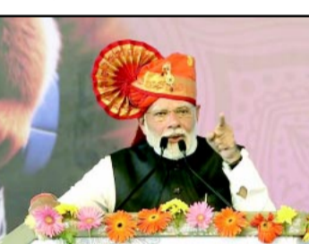
महोत्सव की मेजबानी महाराष्ट्र कर रहा है। इस मौके पर प्रधानमंत्री ने विश्व पर हमला बोलते हुए वंशवाद को राजनीति को देश के लिए घातक बताते हुए युवाओं से राजनीति में आने का आह्वान किया। उन्होंने कहा कि भारत आज शीर्ष पांच वैश्विक अर्थव्यवस्थाओं में से एक है और

नई दिल्ली (हि.स.)। प्रधानमंत्री नरेंद्र मोदी ने आजादी के अमृतकाल को देश के युवाओं के लिए स्वर्ण युग बताया है। उन्होंने कहा कि आज युवाओं के पास इतिहास में अपना नाम दर्ज करने का मौका है। प्रधानमंत्री ने शुरुआत को महाराष्ट्र के नासिक में 27वें राष्ट्रीय युवा महोत्सव का उद्घाटन किया।