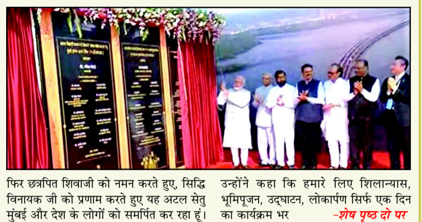
फिर छत्रपति शिवाजी को नमन करते हुए, सिद्धि विनायक जी को प्रणाम करते हुए यह अटल सेतु मुंबई और देश के लोगों को समर्पित कर रहा हूँ। उन्होंने कहा कि हमारे लिए शिलान्यास, भूमिपूजन, उद्घाटन, लोकार्पण सिर्फ एक दिन का कार्यक्रम भर - शेष पृष्ठ दो पर

मुंबई। प्रधानमंत्री नरेंद्र मोदी आज महाराष्ट्र के दौर पर हैं। महाराष्ट्र में अटल सेतु के अलावा पीएम ने कई योजनाओं का तोहफा दिया है। उन्होंने कहा कि आज का दिन मुंबई और महाराष्ट्र के साथ ही विकसित भारत के संकल्प के लिए ऐतिहासिक है। आज दुनिया के सबसे बड़े पुल में से एक अटल सेतु देश को मिला है। आज का ये कार्यक्रम संकल्प से सिद्धि का प्रमाण है। उन्होंने कहा कि 24 दिसंबर 2016 का दिन मैं नहीं भूल सकता। जब मैं अटल सेतु के शिलान्यास के लिए यहां आया था। तब मैंने छत्रपति शिवाजी को नमन करते हुए कहा था कि लिखकर रखिए... देश बदलेगा भी और देश बड़ेगा भी। पीएम ने कहा कि ये मोदी की गारंटी थी और आज मैं