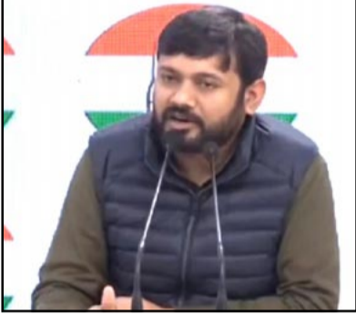
महिलाओं के लिए एक सुरक्षित और स्वतंत्र समाज का निर्माण करना, किसानों को उनकी

गुवाहाटी (हि.स.)। देश में सामाजिक, आर्थिक और राजनीतिक न्याय स्थापित करने के लिए ही भारत जोड़ो न्याय यात्रा हो रही है। देश को युवा न्याय, भागीदारी न्याय, नारी न्याय, किसान न्याय और श्रमिक न्याय की जरूरत है। इससे देश को शक्ति मिलेगी। गुरुवार को भारत जोड़ो न्याय यात्रा के मद्देनजर यहां भारतीय राष्ट्रीय छात्र संघ (एनएसयूआई) के प्रभारी कन्हैया कुमार ने एक संवाददाता सम्मेलन में कहा। उन्होंने कहा कि हमारे देश की बहुसंख्यक आबादी आज भी न्याय की संपूर्ण स्थापना से दूर है। पांच न्याय के उद्देश्य की व्याख्या करते हुए उन्होंने कहा कि युवा न्याय का मतलब है, युवाओं को रोजगार मिले। सभी क्षेत्र में लोगों को भागीदारी सुनिश्चित करनी है,