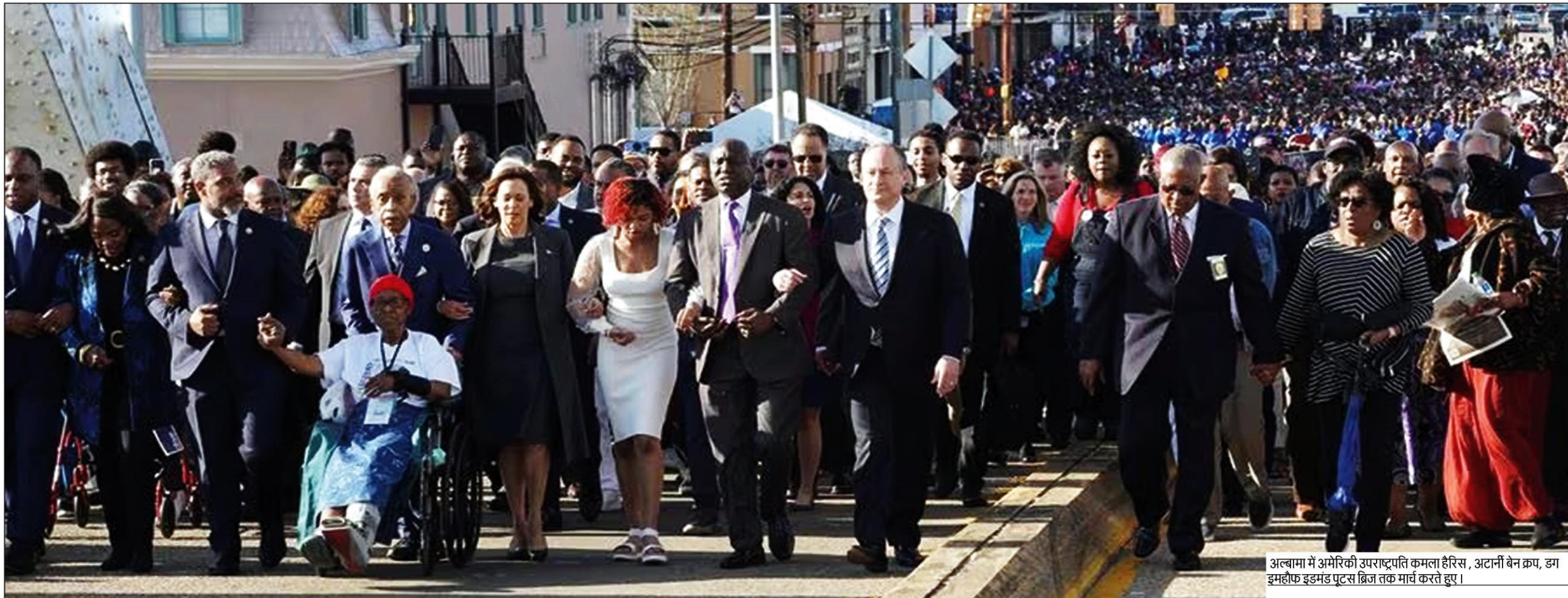
अल्बामा में अमेरिकी उपराष्ट्रपति कमला हैरिस, अटॉर्नी जनरल, डग इमहोफ इडमंडस पुटस ब्रिज तक मार्च करते हुए।