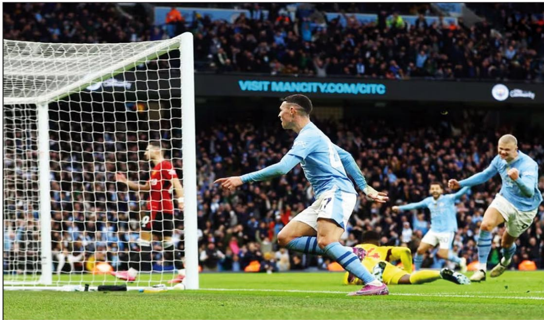
मैनचेस्टर में प्रीमियर लीग फुटबॉल में गोल करते हुए मैनचेस्टर सिटी के फिल फोडन।

न्यूजीलैंड के डेवोन कॉनवे ऑस्ट्रेलिया के साथ जारी टी20 सीरीज में चोटिल हो गये हैं। इसके कारण अब उनकी सर्जरी की जाएगी। ऐसे में उन्हें करीब तीन माह तक खेल से दूर रहना पड़ेगा। कीवी खिलाड़ी कॉनवे की चोट से आईपीएल टीम चेन्नई सुपर किंग्स (सीएसके) की मुश्किलें भी बढ़ गयी हैं। इसका कारण है कि कॉनवे सीएसके टीम के प्रमुख बल्लेबाज हैं। सीएसके की ओर से अब तक 23 मैच खेलकर कॉनवे ने 48 की औसत से 9 अर्धशतक लगाकर कुल 924 रन बनाए हैं। अब सर्जन के बाद उनका ट्रान्मिंट से बाहर होना तय है। सीएसके की ओर से कॉनवे ने गत दो सत्र में शानदार प्रदर्शन किया था। कॉनवे अब ट्रान्मिंट से पहले ही अंगुठे में चोट के कारण मई तक मैदान से बाहर रहेंगे। कॉनवे को लेकर न्यूजीलैंड क्रिकेट बोर्ड ने सोशल मीडिया पर कहा कि इस बल्लेबाज की चोट गंभीर है और उनको अगले सप्ताह सर्जरी करानी होगी। उनके अंगुठे में गंभीर चोट आई थी और सर्जरी के बाद आठ सप्ताह तक वह मैदान से बाहर रहेंगे। कॉनवे ने पिछले सत्र में चेन्नई की ओर से अच्छी बल्लेबाजी की थी। 11 करोड़ रुपये में टीम में शामिल किए गए इस बल्लेबाज ने 16 मैच में 6 अर्धशतक लगाकर कुल 672 रन बनाये हैं। इस दौरान उन्होंने 92 रन की नाबाद पारी भी खेली थी। वह सबसे ज्यादा रन बनाने वाले बल्लेबाजों में तीसरे नंबर पर रहे थे।