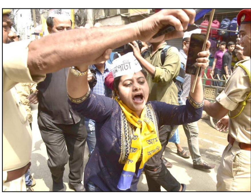
दिल्ली के मुख्यमंत्री अरविंद केजरीवाल की गिरफ्तारी को लेकर महानगर में आप कार्यकर्ताओं ने किया विरोध-प्रदर्शन।