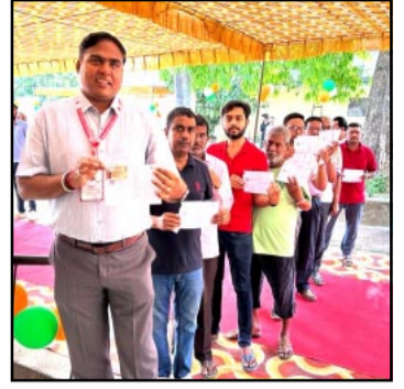
लखनऊ (हिंस) । लोकसभा चुनाव के सातवें चरण में आज शनिवार को उत्र की 13 सीटों पर शाम पांच बजे तक 54.00 प्रतिशत मतदान हुआ है। सबसे अधिक मतदान महाराजगंज 58.66 प्रतिशत हुआ है जबकि सबसे कम बांसगांव (सुरक्षित) सीट पर 52.06 प्रतिशत मत पड़े हैं। मतदेय स्थलों पर मतदाताओं की लाइनें लगी हैं और शांतिपूर्ण मतदान जारी है।

सशक्तिकरण को नई दिशा दी है। मुख्यमंत्री योगी ने युवा मतदाताओं से कहा उन्हें अपने उज्ज्वल भविष्य के लिए मोदी जी की संकल्पना से जुड़कर बेहतरीन इंफ्रास्ट्रक्चर युक्त नए भारत, दुनिया में सम्मान प्राप्त कर रहे नए भारत को आगे बढ़ाने के अभियान में बढ़-चढ़कर भाग लेना चाहिए और लोकतंत्र को मजबूत करना चाहिए। उन्होंने कहा कि जो दल, जो लोग अपनी हार से परत होकर युवाओं को गुमराह करने का प्रयास कर रहे हैं, उनके बहकावे में नहीं आना चाहिए। आत्मनिर्भर और विकसित भारत के लक्ष्य में ही हम सबका भविष्य उज्ज्वल है और युवाओं को भी इसी लक्ष्य के प्रति मतदान करना चाहिए। उन्होंने कहा कि मोदी जी ने सिर्फ चार जातियों को माना है, युवा, गरीब, महिला व किसान। इनके लिए उन्होंने जो कार्य किए हैं, उसके लिए जनता पूरा आशीर्वाद दे रही है। मुख्यमंत्री योगी आदित्यनाथ ने प्रधानमंत्री नरेंद्र मोदी की आध्यात्मिक-राष्ट्र साधना पर विपक्षी दलों के नेताओं की तरफ से दिए जा रहे बयानों पर भी तीखी प्रतिक्रिया दी।