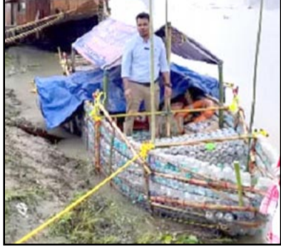
गुवाहाटी तक की यात्रा है, जिसमें प्लास्टिक-मुक्त ब्रह्मपुत्र और नदी पर्यटन उनके विषयों के रूप में हैं। ब्रह्मपुत्र की उफनती जलधारा पर पानी की कुल 3,000 बोटलों के साथ तीस फुट लंबी