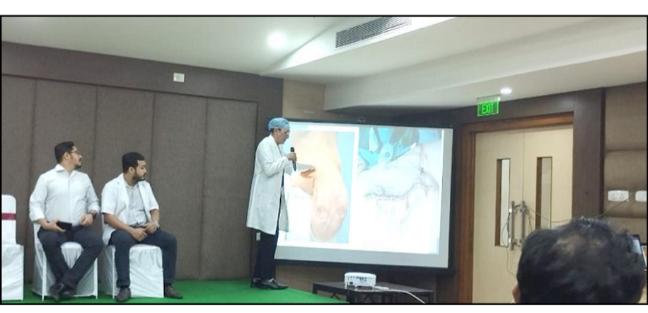
रही है। फासिओटेंस हर्निया के उपचार में एक प्रमुख प्रगति का प्रतिनिधित्व करता है। हाल ही में, गंभीर रूप से