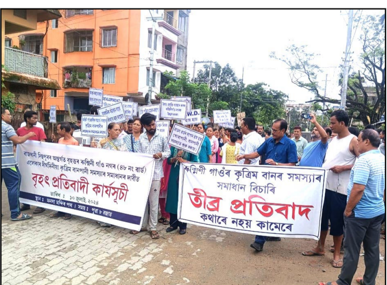
अधिकारियों से बाढ़ की समस्या से निपटने के लिए तत्काल कार्यवाही करने तथा भविष्य

गुवाहाटी। रुक्मिणीगांव के कम से कम 300 निवासी बुधवार (10 जुलाई) को अपने इलाके में लगातार रही बाढ़ की समस्या के खिलाफ प्रदर्शन करने के लिए सड़क पर एकत्र हुए। इस प्रदर्शन में बार-बार होने वाली जलभराव की समस्या से उनकी हताशा को उजागर किया गया, जिसने उनके दैनिक जीवन को बुरी तरह से प्रभावित किया है। सुबह करीब 9 बजे विरोध प्रदर्शन शुरू हुआ, जिसमें निवासियों ने प्रभावी जल निकासी व्यवस्था की कमी और स्थानीय अधिकारियों की अपर्याप्त प्रतिक्रिया के बारे में अपनी चिंता व्यक्त की। उन्होंने तख्तियां ले रखी थीं और नारे लगाए, जिसमें सरकार से उनकी दुर्दशा को प्राथमिकता देने और त्वरित कदम उठाने का आग्रह किया गया। एक स्थानीय निवासी ने कहा कि हम वर्षों से इन समस्याओं का सामना कर रहे हैं, और कुछ भी बदलता नहीं दिख रहा है। हर मानसून में हमारे घर और सड़कें जलमग्न हो जाती हैं, जिससे सामान्य जीवन जलान असंभव हो जाता है। प्रदर्शनकारियों ने नगर निगम