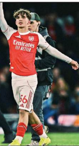
खिलाड़ी, स्टाफ और दर्शक सभी बेहद उत्साहित नजर आए। मैच के बाद आर्सनल के मैनेजर

मुकाबले के अंतिम क्षणों में आया यह गोल आर्सनल की जीत को पक्का करने वाला साबित हुआ। इस जीत के साथ टीम ने लीग तालिका में शीर्ष स्थान पर अपनी पकड़ और मजबूत कर ली। युवा खिलाड़ी के इस प्रदर्शन से क्लब के