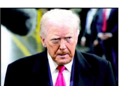
खुलवाने की अपील कर रहे हैं। हालांकि इन देशों ने साफ कर दिया है कि वे होर्मुज स्ट्रेट में अपने वॉरशिप नहीं भेजेंगे। यह फैसला ऐसे समय आया है जब अमेरिकी राष्ट्रपति डोनाल्ड ट्रम्प ने चेतावनी दी थी कि अगर नाटो देश अहम समुद्री रास्ते को फिर से खोलने में मदद नहीं करते, तो नाटो का भविष्य खराब हो सकता है। द गार्जियन की रिपोर्ट के मुताबिक जर्मनी ने साफ कहा है कि वह