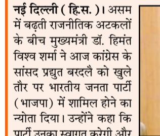
नई दिल्ली (हि.स.)। असम में बढ़ती राजनीतिक अटकलों के बीच मुख्यमंत्री डॉ. हिमंत विश्व शर्मा ने आज कांग्रेस के सांसद प्रद्युम्न बरदलै को खुले तौर पर भारतीय जनता पार्टी (भाजपा) में शामिल होने का न्योता दिया। उन्होंने कहा कि पार्टी उनका स्वागत करेगी और यह सुनिश्चित करेगी कि उन्हें विधानसभा चुनाव लड़ने का मौका मिले। भाजपा की रणनीति बैठक में हिस्सा लेने के लिए नई दिल्ली पहुंचे मुख्यमंत्री डॉ. शर्मा ने