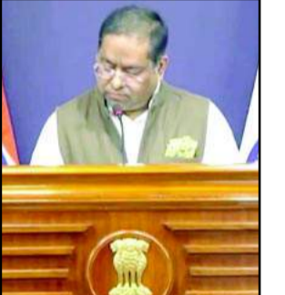
नई दिल्ली (हि.स.)। भारत ने 16 मार्च को रात काबुल के ओमिद नशा

काबुल के अस्पताल पर पाकिस्तान के बर्बर हवाई हमले की भारत ने की घोर निंदा