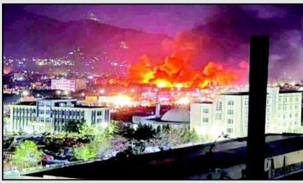
अस्पताल को निशाना बनाकर किए गए हवाई हमले की कड़ी निंदा करते हुए इसे

बीच एक महीने से चल रहे टकराव के बीच स्थितियां तेजी से बिगड़ रही हैं। पाकिस्तान की तरफ से देर रात अफगानिस्तान की राजधानी काबुल में एक नशा मुक्ति केंद्र को निशाना बनाया गया है। हमले में अस्पताल को काफी नुकसान हुआ है। इमारत का ज्यादातर हिस्सा आग लगने के कारण तबाह हो चुका है। बताया जा रहा है कि हमले के समय इस केंद्र पर दो हजार से अधिक लोग मौजूद थे जिसमें कम-से-कम सौ लोगों की