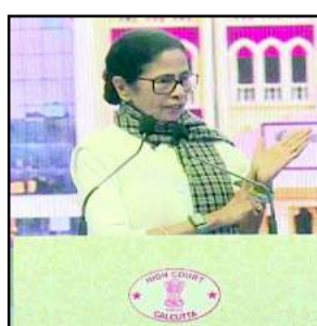
कोलकाता (हि.स.)। पश्चिम बंगाल विधानसभा चुनाव के लिए तृणमूल कांग्रेस ने अपने उम्मीदवारों की सूची जारी कर दी है। पार्टी ने इस बार 52 महिला उम्मीदवारों को टिकट दिया है, जिसमें युवा तथा अनुभवी नेताओं के बीच संतुलन बनाने की कोशिश की गई है। भवानीपुर विधानसभा क्षेत्र से विधायक मुख्यमंत्री ममता बनर्जी इस बार भी इसी सीट से चुनाव लड़ेगी। ममता बनर्जी ने घोषणा की कि दार्जिलिंग क्षेत्र की तीन सीटों पर तृणमूल चुनाव नहीं लड़ेगी। पार्टी प्रमुख और मुख्यमंत्री ममता बनर्जी ने मंगलवार को