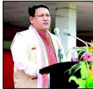
गुवाहाटी। भारतीय जनता पार्टी से राष्ट्रीय लोकतांत्रिक गठबंधन में अपनी स्थिति स्पष्ट करने के लिए

कहने के एक सप्ताह बाद, यूनाइटेड पीपुल्स पार्टी लिबरल (यूपीपीएल) ने असम में अपना अलग रास्ता चुनने का फैसला किया है। मंगलवार (17 मार्च, 2026) को यूपीपीएल ने कहा कि उसने वैचारिक मतभेदों के कारण एनडीए से नाता तोड़ लिया है और वह 9 अप्रैल को होने वाले चुनाव में असम की 126 विधानसभा सीटों में से 21 पर चुनाव लड़ेगी। इनमें से छह निर्वाचन क्षेत्र यूपीपीएल के गढ़ बोडोलैंड प्रादेशिक क्षेत्र (बोटीआर) से बाहर हैं, जिसकी 15 सीटें तब महत्वपूर्ण हो जाती हैं जब राज्य में किसी