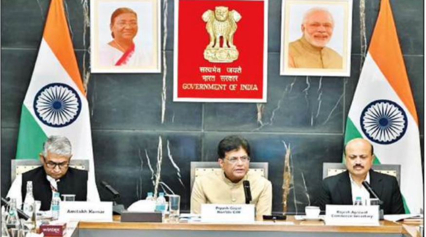
केंद्र सरकार ने 30 जून तक महत्वपूर्ण पेट्रोसायन उत्पादों को पूर्ण सीमा शुल्क से छूट दी

गोयल ने मीडिया को बताया कि हम 'निवेश सुविधा विकास समझौता' (आईएफडी) जैसे बहुपक्षीय समझौतों का विरोध किया और डब्ल्यूटीओ-एमसी14 में उचित सुरक्षा उपायों तथा आम सहमति के बिना उन्हें डब्ल्यूटीओ के दायें में शामिल करने पर अपनी सहमति नहीं दी।