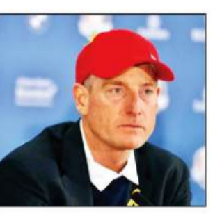
ऐसे चौथे अमेरिकी कप्तान बन गए हैं जिन्हें दूसरी बार यह जिम्मेदारी सौंपी गई है।

न्यूयॉर्क/लिमरिफ। अमेरिका के अनुभवी गोल्फर जिम फ्यूरिक को 2027 राइडर कप के लिए यूएस टीम का कप्तान नियुक्त किया गया है। यह टूर्नामेंट आस्ट्रेलिया के लिमरिफ स्थित अजारे मैजर में खेला जाएगा। यह फैसला उस समय आया जब दिग्गज गोल्फर टाइगर वुड्स ने इस भूमिका को स्वीकार करने से इंकार कर दिया।