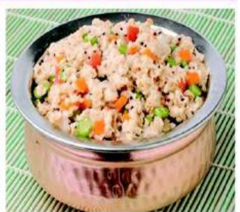
धनिया पत्ता मुट्ठी भर करी पत्ता थोड़ा सा