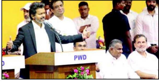
चेन्नई। राज्यपाल राजेंद्र विश्वनाथ अलंकार को बहुमत दिलाने के लिए लगातार चार दिनों तक चले संघर्ष के बाद, तमिलनाडु वेटी कजगम (टीवीके) के प्रमुख सी. जोसेफ विजय ने तमिलनाडु के नौवें मुख्यमंत्री के रूप में शपथ ली। थलपति का शपथ ग्रहण समारोह चेन्नई के जवाहरलाल नेहरू स्टेडियम में एक भव्य आयोजन -शेष पृष्ठ दो पर