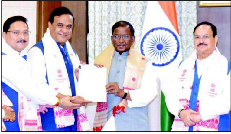
असम विधानसभा के नेता नियुक्त होने के बाद, हिमंत विश्व शर्मा ने असम के राज्यपाल लक्ष्मण प्रसाद आचार्य को बहुमत वाली विधायकों की सूची सौंपी। इस तस्वीर में केंद्रीय स्वास्थ्य मंत्री जे.पी. नड्डा भी गुवाहाटी के लोक भवन में रविवार को दिखाई दे रहे हैं।

गुवाहाटी ( एजे./हि.स. )। असम में भाजपा नेता डॉ. हिमंत विश्व शर्मा को भाजपा और एनडीए विधायक दल का नेता चुन लिया गया है। वह 12 मई को असम के मुख्यमंत्री पद की शपथ लेंगे। इस शपथ ग्रहण समारोह में प्रधानमंत्री नरेंद्र मोदी मुख्य अतिथि के रूप में शामिल होंगे। गुवाहाटी में रविवार को हुई एक महत्वपूर्ण बैठक में हिमंत विश्व शर्मा को भाजपा के नेतृत्व वाले एनडीए विधायक दल का नेता चुना गया। केंद्रीय मंत्री जेपी नड्डा ने इस बड़े फैसले की जानकारी सार्वजनिक की। इस चुनाव के साथ ही अब शर्मा का लगातार दूसरी बार असम का मुख्यमंत्री बनने का रास्ता पूरी तरह साफ हो गया है। असम भाजपा विधायक दल की बैठक सुबह आयोजित हुई थी। इसमें आठ भाजपा विधायकों ने नेता के रूप में हिमंत विश्व शर्मा के नाम का प्रस्ताव रखा। इस पूरी प्रक्रिया के दौरान जेपी नड्डा और हरियाणा के मुख्यमंत्री नाथ सिंह सैनी केंद्रीय पर्यवेक्षक और सह-पर्यवेक्षक के रूप में बैठक में मौजूद रहे। गठबंधन के प्रमुख साथी दलों, असम गण परिषद (अगप) और बोडोलैंड पीपुल्स फ्रंट (बीपीएफ) ने भी शर्मा के नामांकन का पूरा समर्थन किया। सभी दलों की सहमति के बाद उन्हें सर्वसम्मति से एनडीए का नेता चुन लिया गया। इसके बाद, हिमंत विश्व शर्मा और एनडीए के अन्य वरिष्ठ नेताओं ने लोक भवन में