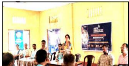
अधिकारी पूरे जिले के गांवों का दौरा कर रहे हैं, ताकि जनता की शिकायतों का समाधान किया जा सके, समस्याओं का त्वरित निवारण सुनिश्चित हो सके और जमीनी स्तर पर सेवा वितरण तंत्र को मजबूत बनाया जा सके। बाक्सो जिले के विभिन्न विकास खंडों में भी इसी तरह के जन सुनवाई कार्यक्रम आयोजित किए गए, जिनमें विभिन्न विभागों के अधिकारियों ने सक्रिय रूप से हिस्सा लिया।

बाक्सो। बाक्सो की उपायुक्त, किमनेई चांगसन ने जनजातीय गरिमा उत्सव 2026 के तहत चलाए जा रहे जन भागीदारी अभियान के हिस्से के रूप में, बाक्सो विकास खंड के कई गांवों में आयोजित जन सुनवाई कार्यक्रमों का दौरा किया और उनमें हिस्सा लिया। इस अभियान की थीम सबसे दूर, सबसे पहले रखी गई है। इस कार्यक्रम के दौरान, उपायुक्त ने स्थानीय निवासियों से बातचीत की और उनकी शिकायतों व चिंताओं को सुना। उन्होंने नागरिकों से आग्रह किया कि वे 23 मई तक चलने वाली इस जन सुनवाई पहल में सक्रिय रूप से हिस्सा लें, और लोगों को आगे आकर प्रशासन के सामने अपनी शिकायतें रखने के इस अवसर का लाभ उठाने के लिए प्रोत्साहित किया। इस कार्यक्रम में महिलाओं की अधिक से अधिक भागीदारी सुनिश्चित करने पर भी विशेष जोर दिया गया। इस पहल के तहत, विभिन्न विभागों के