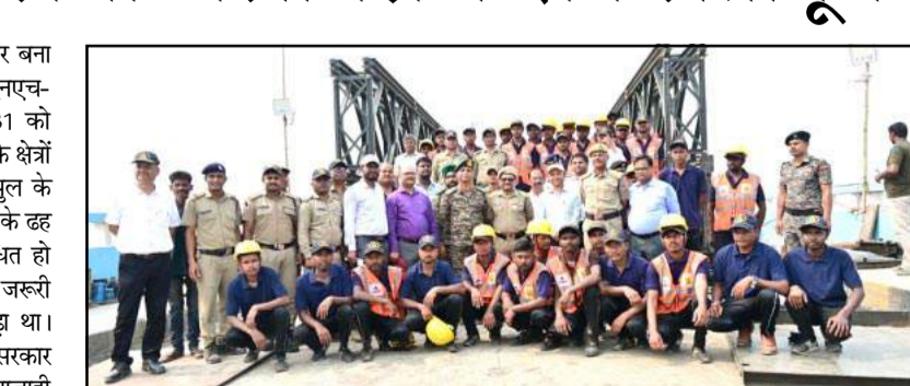
रहत प्रदान करने के लिए, युद्धस्तर पर इन बेली ब्रिजों को स्थापित करने का चुनौतीपूर्ण कार्य अपने हाथ में लिया है। प्रोजेक्ट स्वस्तिक की निर्माण टीम ने बहुत कम समय में 170 फीट लंबा बेली ब्रिज तैयार करके लांच कर दिया है। वर्तमान में लांच किए गए पुल के अलावा, राज्य सरकार के अनुरोध पर, विक्रमशिला सेतु के क्षतिग्रस्त हिस्सों

भागलपुर। विक्रमशिला सेतु, गंगा नदी पर बना एक महत्वपूर्ण 4.88 किमी लंबा पुल है जो एनएच-33 (पुराना एनएच-80) और एनएच-31 को जोड़ता है; यह भागलपुर और आस-पास के क्षेत्रों के लिए जीवनरेखा का काम करता है। पुल के 34-मीटर लंबे नेविगेशनल स्पैन (हिस्से) के ढह जाने के बाद, यातायात पूरी तरह से बाधित हो गया था, जिससे लोगों की आवाजाही और जरूरी सेवाओं के परिवहन पर गंभीर असर पड़ा था। स्थिति को गंभीरता को समझते हुए, बिहार सरकार ने हल्के वाहनों और जरूरी सेवाओं की आवाजाही को आसान बनाने के लिए, आपातकालीन पुल समाधानों की तैनाती हेतु रक्षा मंत्रालय से तत्काल सहायता का अनुरोध किया। रक्षा मंत्रालय ने मरम्मत और बहाली का काम सीमा सड़क संगठन (बीआरओ) को सौंपा। इसके परिणामस्वरूप, बीआरओ ने कनेक्टिविटी बहाल करने और उत्तरी व दक्षिणी बिहार की प्रभावित आबादी को तत्काल