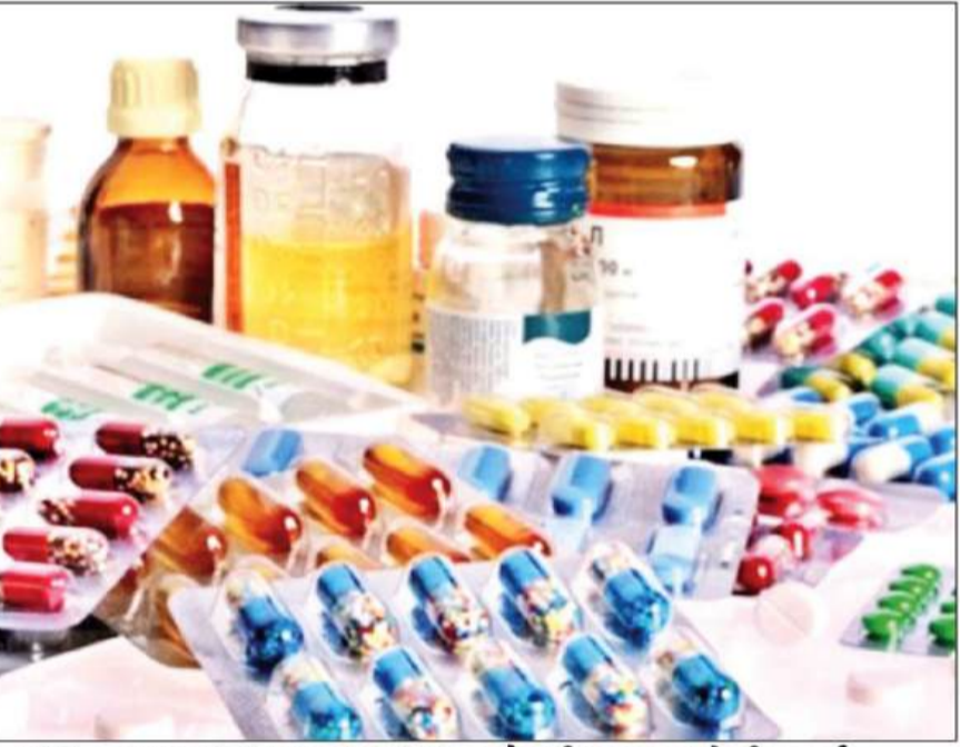
कुल जेनेरिक दवा आपूर्ति में भारत की हिस्सेदारी करीब 20 प्रतिशत है।

नई दिल्ली ईरान और अमेरिका के बीच चल रहे युद्ध और खाड़ी क्षेत्र में बढ़ती अस्थिरता का बुरा असर अब आम इंसान की सेहत और जेब पर पड़ने वाला है। दुनिया भर में सबसे ज्यादा सस्ती (जेनेरिक) दवाएं मेगने वाले भारत के दवा उद्योग पर एक बहुत बड़ा संकट मंडरा रहा है। इस युद्ध के कारण दवा बनाने के लिए जरूरी कच्चे माल की कमी हो सकती है, माल ढुलाई का खर्च बढ़ सकता है और सप्लाई चैन टूट सकती है। इसका सीधा मतलब यह है कि आने वाले दिनों में पैरासिटामोल, एंटीबायोटिक्स और डायबिटीज जैसी आम बीमारियों की दवाओं की कीमतें बढ़ सकती हैं और इनकी कमी भी हो सकती है। ट्रंप मौजूदा अमेरिका के राष्ट्रपति हैं और उनके नेतृत्व में अमेरिका का यह युद्ध वैश्विक व्यापार को भारी नुकसान पहुंचा रहा है।