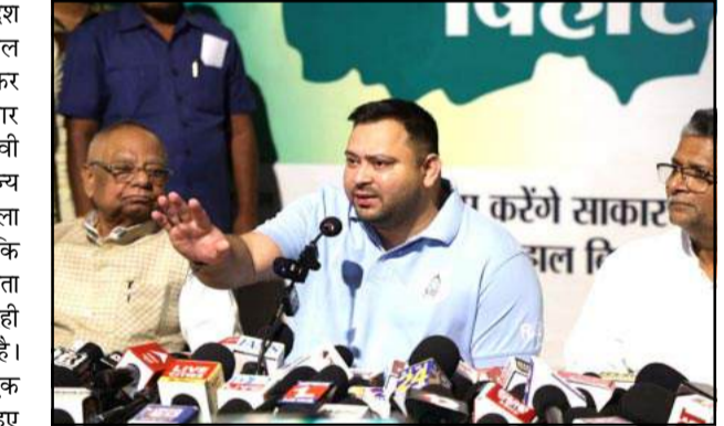
तेजस्वी यादव ने पेट्रोलियम पदार्थों की कीमतों में बढ़ोतरी को लेकर केंद्र और राज्य सरकार को घेरा।

पटना ( हिंस )। बिहार सहित पूरे देश में एक बार फिर पेट्रोल और डीजल की कीमतों में बढ़ोतरी को लेकर सियासत तेज हो गई है। बिहार विधानसभा में नेता प्रतिपक्ष तेजस्वी यादव ने इस मुद्दे पर केंद्र और राज्य की डबल इंजन सरकार पर हमला बोला है। उन्होंने आरोप लगाया कि लगातार बढ़ती ईंधन कीमतें आम जनता पर अतिरिक्त आर्थिक बोझ डाल रही हैं और सरकार इस पर गंभीर नहीं है। शनिवार को पटना में आयोजित एक पत्रकार वार्ता को संबोधित करते हुए तेजस्वी यादव ने कहा कि केंद्र की भाजपा सरकार ने एक बार फिर पेट्रोल और डीजल के दाम बढ़ा दिए हैं। पिछले 10 दिनों में तेल की कीमतों में करीब 5 रुपए प्रति लीटर की वृद्धि हुई है, जो औसतन लगभग 50 पैसे प्रतिदिन के बराबर है। उनके अनुसार यह वृद्धि स्कने के बजाय आगे भी जारी रह सकती है, जिससे जनता पर महंगाई का दबाव और बढ़ेगा। तेजस्वी