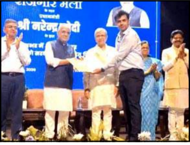
रेलवे मंत्री अश्विनी वैष्णव जयपुर में आयोजित रोजगार मेले में भाग लिया और विभिन्न केंद्रीय विभागों में चयनित 420 युवाओं को नियुक्ति पत्र बांटे।

जयपुर ( हिंस )। केंद्रीय रेल मंत्री अश्विनी वैष्णव शनिवार को जयपुर दौर पर रहे। उन्होंने जयपुर स्थित कॉन्सटीट्यूशन क्लब ऑफ राजस्थान में आयोजित रोजगार मेले में भाग लिया और विभिन्न केंद्रीय विभागों में चयनित 420 युवाओं को नियुक्ति पत्र बांटे। इस दौरान रेल मंत्री ने बताया कि रेलवे में जल्द ही एक लाख 78 हजार पदों पर भर्ती निकाली जाएगी। रोजगार मेले के दौरान रेल मंत्री अश्विनी वैष्णव ने युवाओं को संबोधित करते हुए कहा कि रेलवे में भर्ती प्रक्रिया को अब अधिक पारदर्शी और समयबद्ध बनाया गया है। पहले भर्ती प्रक्रियाएँ वर्षों तक चलती थीं, लेकिन अब वार्षिक भर्ती कैलेंडर लागू होने से युवाओं को पहले से जानकारी मिल रही है कि किस समय कौन-सी भर्ती निकलेगी। उन्होंने बताया कि रेलवे भर्ती प्रक्रिया को चार चरणों में विभाजित किया गया है। पहले क्वार्टर में लोको पायलट, दूसरे क्वार्टर में टेक्निसियन एवं अन्य तकनीकी पदों, तीसरे क्वार्टर में नॉन टेक्निकल पॉपुलर कैटेगरी जैसे