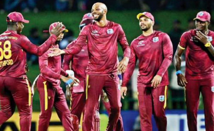
और उन्होंने सात पारियों में सिर्फ 78 रन बनाए। अल्जारी जोसेफ की वापसी से गेंदबाजी को मजबूती तैज गेंदबाज अल्जारी जोसेफ पीठ की चोट से

एटिंग्टन वेस्टइंडीज क्रिकेट बोर्ड (सीडब्ल्यूआई) ने श्रीलंका के खिलाफ आगामी वनडे श्रृंखला के लिए रविवार को टीम की घोषणा कर दी है। स्टार बल्लेबाज शिमरान हेटमायर की एक बार फिर वनडे टीम में वापसी हुई है, जबकि तेज गेंदबाज अल्जारी जोसेफ चोट से उबरने के बाद अंतरराष्ट्रीय क्रिकेट में लौटने के लिए तैयार हैं। क्रिकेट वेस्टइंडीज ने स्पष्ट किया है कि हेटमायर को 2027 वनडे विश्व कप की तैयारियों को ध्यान में रखते हुए टीम में दोबारा शामिल किया गया है। हेटमायर ने आखिरी बार जून 2025 में इंग्लैंड के खिलाफ वनडे मैच खेला था। इसके बाद वह पाकिस्तान, बांग्लादेश और न्यूजीलैंड के खिलाफ हुई तीन वनडे श्रृंखलाओं से बाहर रहे थे। हाल ही में हुए टोटो विश्व कप में हेटमायर ने शानदार प्रदर्शन करते हुए 248 रन बनाए थे। हालांकि आईपीएल 2026 में राजस्थान रायल्स के लिए उनका प्रदर्शन उम्मीद के मुताबिक नहीं रहा