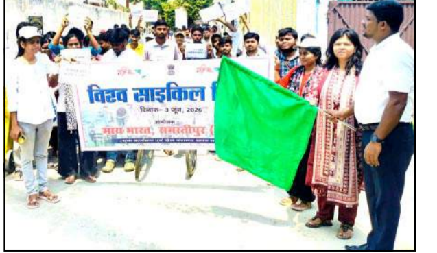
समस्तीपुर (हिंस)। विश्व साइकिल दिवस के अवसर माय भारत युवा कार्यक्रम एवं खेल मंत्रालय भारत सरकार के द्वारा सबसे मिशन क्लब के परिसर से बीएड कॉलेज तक साईकिल रैली निकाली गई। उक्त रैली को माय भारत के उप निदेशक अधिक है। आरजेएसएफ यूनिट उन व्यक्तियों पर भी नजर रख रही है जिन्हें संगठित अपराधिक गिरोह अपने नेटवर्क में शामिल करने का प्रयास कर सकते हैं। पुलिस अधिकारियों के अनुसार गैंगस्टर गिरोह छोटे अपराधियों, जमानत पर बाहर आए आरोपियों या आपराधिक प्रवृत्ति के युवाओं को अपने नेटवर्क में शामिल करने की कोशिश कर रहे हैं। यूनिट ऐसे व्यक्ति को पहचान करने की गतिविधियों का विद्वेषण कर रही है ताकि उन्हें अपराध की दुनिया में और अधिक सक्रिय होने से पहले चिन्हित किया जा सके।

इन अपराधियों का केवल रिकॉर्ड तैयार नहीं किया गया, बल्कि उन्हें विभिन्न श्रेणियों में बांटे हुए उनके जोखिम स्तर का भी आकलन किया गया है। इससे पुलिस को यह समझने में मदद मिल रही है कि कौन से अपराधी दोबारा अपराध कर सकते हैं और किन व्यक्तियों के संगठित अपराधिक गिरोहों के संपर्क में आने की संभावना अधिक है। आरजेएसएफ यूनिट उन व्यक्तियों पर भी नजर रख रही है जिन्हें संगठित अपराधिक गिरोह अपने नेटवर्क में शामिल करने का प्रयास कर सकते हैं। पुलिस अधिकारियों के अनुसार गैंगस्टर गिरोह छोटे अपराधियों, जमानत पर बाहर आए आरोपियों या आपराधिक प्रवृत्ति के युवाओं को अपने नेटवर्क में शामिल करने की कोशिश कर रहे हैं। यूनिट ऐसे व्यक्ति को पहचान करने की गतिविधियों का विद्वेषण कर रही है ताकि उन्हें अपराध की दुनिया में और अधिक सक्रिय होने से पहले चिन्हित किया जा सके।