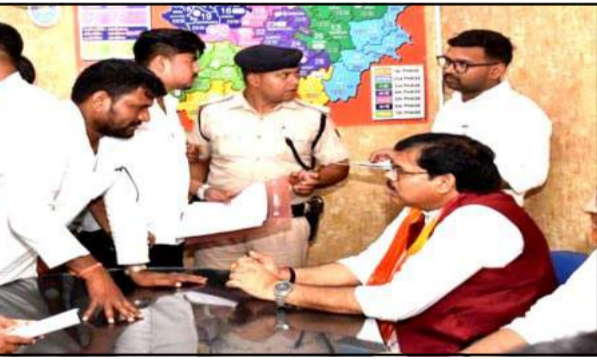
को देखते हुए राज्य के पुलिस महानिदेशक (डीजीपी) से विस्तृत रिपोर्ट मांगी गई है। रिपोर्ट मिलने के बाद पूरे घटनाक्रम की समीक्षा कर आगे की कार्रवाई तय की जाएगी। सरकार यह सुनिश्चित करेगी कि भविष्य में इस तरह की घटनाओं की पुनरावृत्ति न हो। मीडिया से बातचीत के दौरान शिक्षा मंत्री ने कुछ कोचिंग संचालकों को भूमिका पर भी सवाल उठाए। उन्होंने आरोप लगाया कि कई बार छात्र

हालिया घटना का जिक्र करते हुए उन्होंने कहा कि कुछ कोचिंग संस्थानों के बीच प्रतिस्पर्धा अब स्वस्थ शैक्षणिक वातावरण की सीमा से आगे बढ़कर एक-दूसरे को नुकसान पहुंचाने और बदनाम करने तक पहुंच गई है। यह स्थिति शिक्षा जगत के लिए चिंताजनक है। सरकार इस प्रकार की गतिविधियों पर लगातार नजर बनाए हुए है और दोषियों के खिलाफ आवश्यक कार्रवाई की जाएगी। उन्होंने बताया कि मामले की गंभीरता