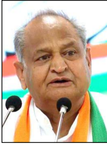
हुआ। मामले को लेकर क्षेत्र में राजनीतिक और सामाजिक चर्चाओं का दौर जारी है। ग्रामीणों ने पेयजल समस्या के स्थायी